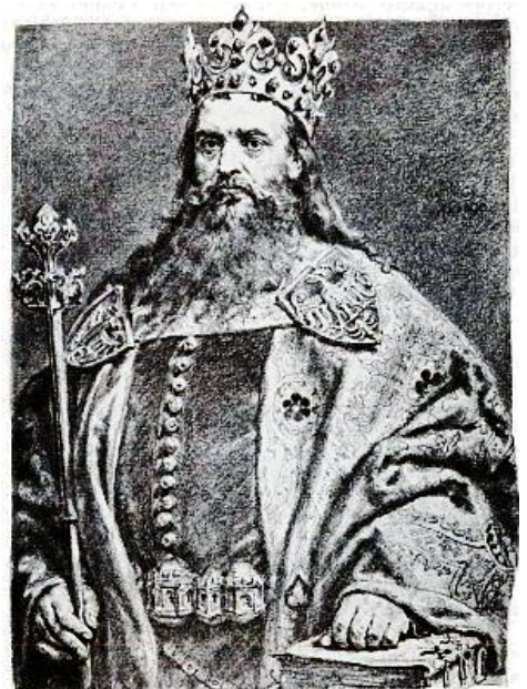
Krół polski Kazimierz Wielki – – fundator kościoła św. Władysława. Obraz Jana Matejki.

Powstanie parafii, uposażenie kościoła i plebana znacząco wpływały na życie miasta. Kościół stanowił silny ośrodek ideologiczny poprzez szeroki zakres oddziaływania na ludność poddaną.