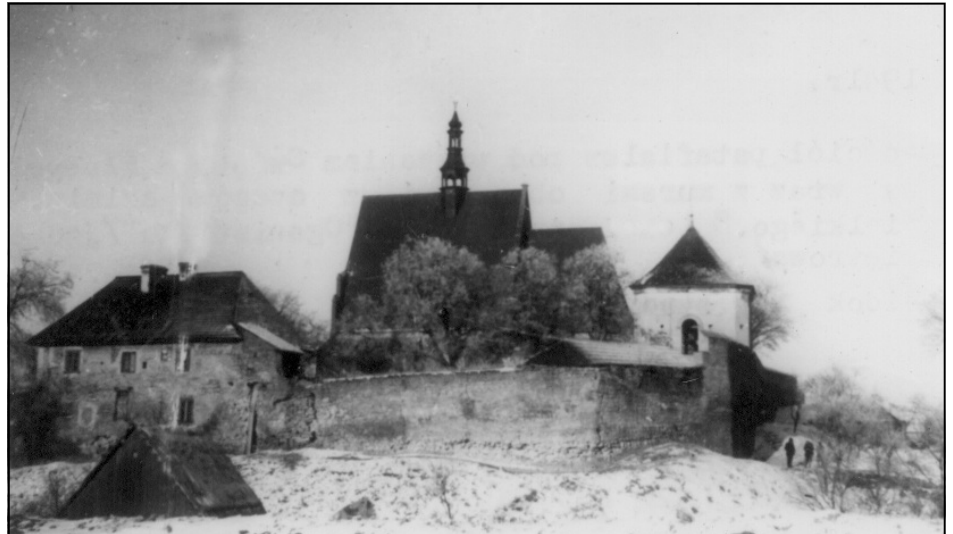
Kompleks kościelny na fotografii z 1941 r. Po lewej nieistniejący budynek wikarówki, w środku kościół, po prawej dzwonnica.